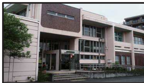
勤労者会館「ライム」 〒344-0061 春日部市粕壁 6615 番地 7

・東武スカイツリーライン・アーバンパークライン：春日部駅西口下車徒歩10分 ・東武アーバンパークライン：八木崎駅下車徒歩10分